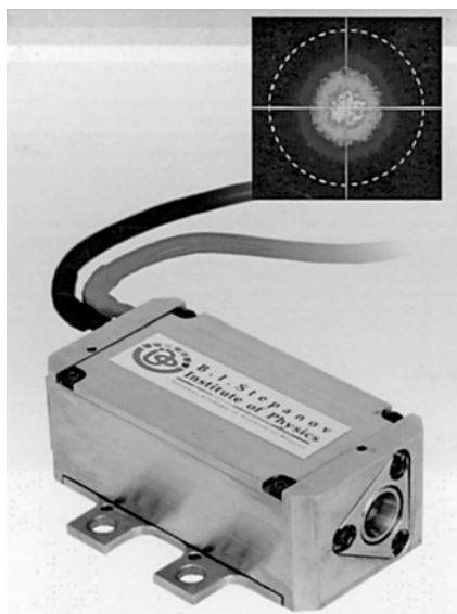
Рис. 3. Эрбиевый лазер с пассивной модуляцией добротности серии IFL-E85P (Институт Физики им. Б. И. Степанова НАН Беларуси)

импульсные Nd:YAG-лазеры, портативные двухимпульсные лазеры, оптические элементы и покрытия (рис. 3).